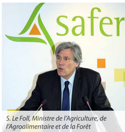
S. Le Foll, Ministre de l'Agriculture, de l'Agroalimentaire et de la Forêt

La réforme territoriale est donc venue apporter un nouveau schéma à ce chantier !